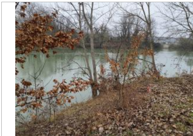
Sol debris vegetaux

Coordonnées WGS84 : X: 1.43905340 / Y: 43.56150400