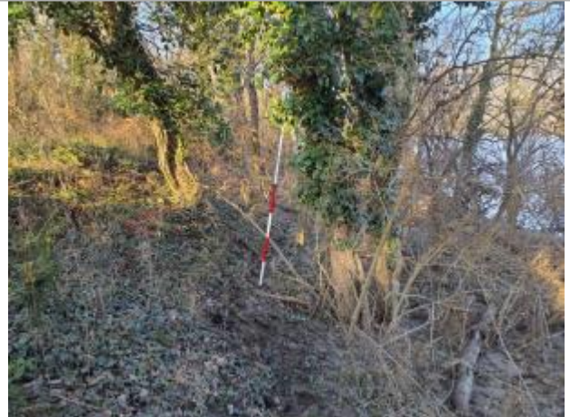
Trace sur végétation