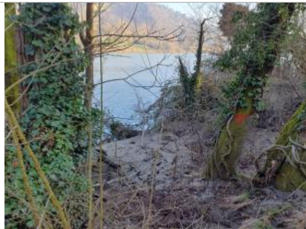
Marque sur Végétation

Coordonnées WGS84 : X: 1.43770890 / Y: 43.55427020