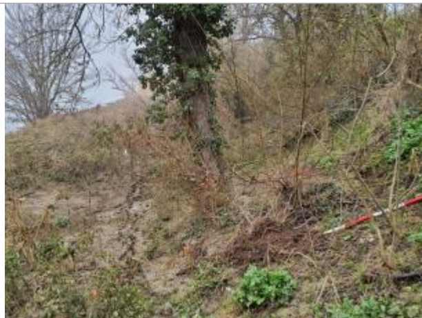
Marque sur Végétation

Coordonnées WGS84 : X: 1.43970380 / Y: 43.55030640