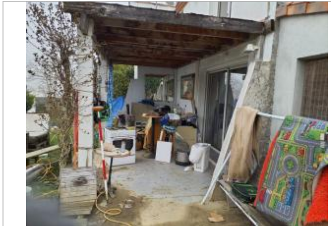
Marque sur meubles

Coordonnées WGS84 : X: 1.43904370 / Y: 43.54781340