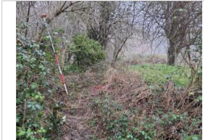
Sol debris vegetaux

Coordonnées WGS84 : X: 1.43732760 / Y: 43.54402670