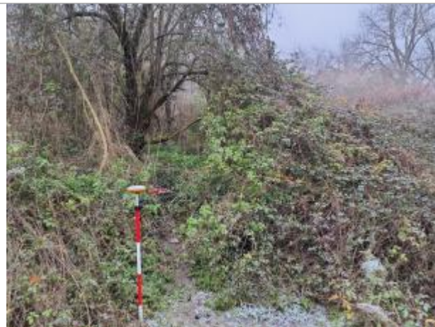
Trace sur végétation