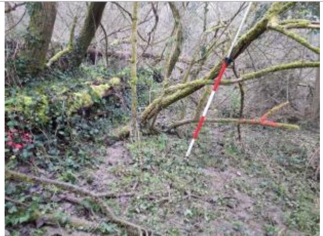
Marque sur Végétation

Coordonnées WGS84 : X: 1.43629100 / Y: 43.54279100