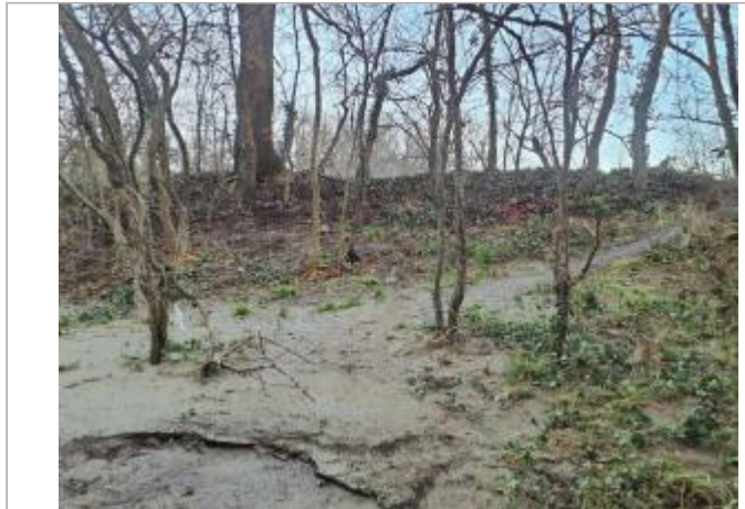
Sol debris vegetaux

Coordonnées WGS84 : X: 1.42845610 / Y: 43.53545790