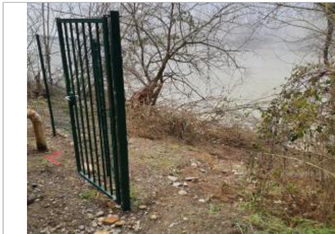
Sol debris vegetaux

Coordonnées WGS84 : X: 1.42936450 / Y: 43.53041580