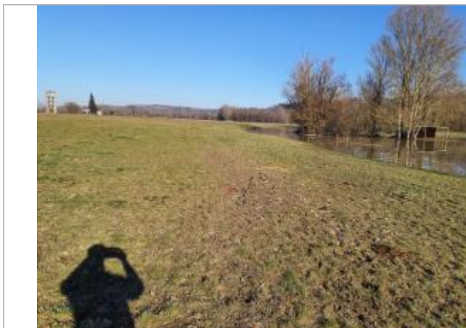
Sol debris vegetaux - Champs

Coordonnées WGS84 : X: 1.41993910 / Y: 43.53130020