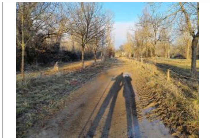
Debris vegetaux au sol sur le Chemin du Port

GÉOLOCALISATION Coordonnées WGS84 : X: 1.41790340 / Y: 43.52455210 Coordonnées RGF93 (Lambert 93) X: 572055.99 / Y: 6270779.08 Coordonnées RGF93 (ETRS89) : X: 1.4179034 / Y: 43.5245521 Code Hydro: O--0000 Rive de référence: Droite