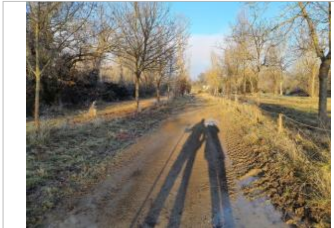
Débris végétaux au sol sur le Chemin du Port

Coordonnées WGS84 : X: 1.41790340 / Y: 43.52455210