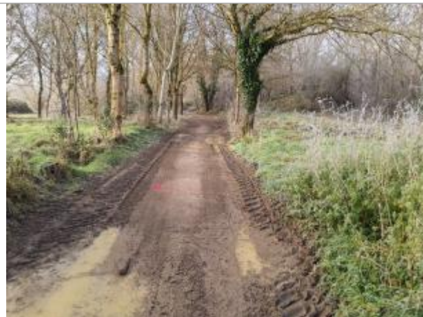
Marque sur chemin en terre proche au Chemin du Port

Coordonnées WGS84 : X: 1.42020750 / Y: 43.52298180