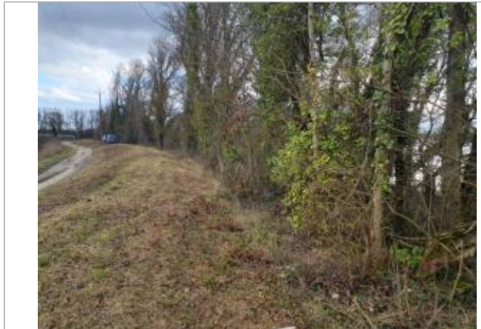
Marque sur Végétation

Coordonnées WGS84 : X: 1.04222050 / Y: 44.08372440