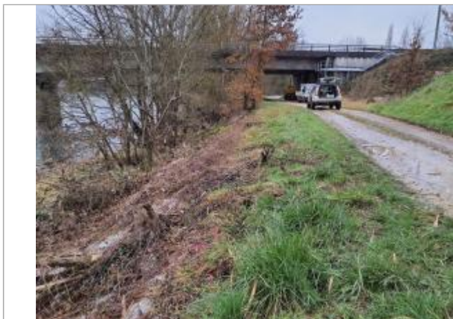
Débris végétaux

Coordonnées WGS84 : X: 1.06283640 / Y: 44.04453830