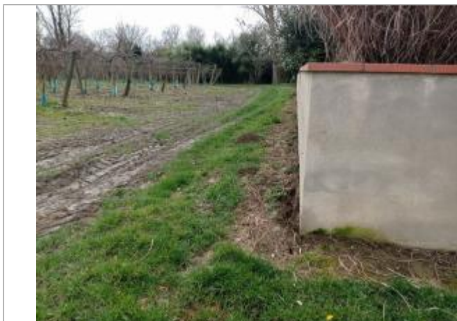
Marque surstructure