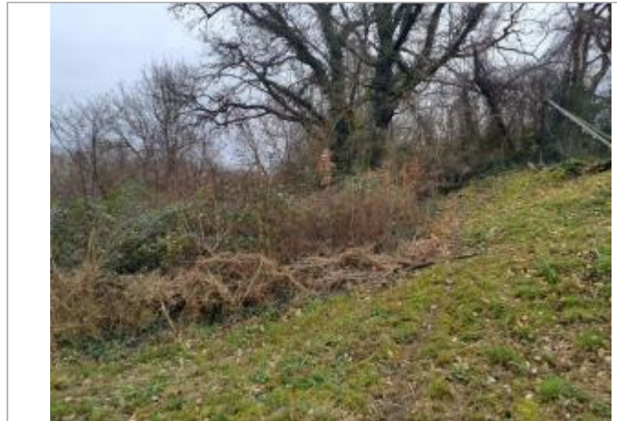
Débris végétaux

Coordonnées WGS84 : X: 1.11989100 / Y: 43.99635090