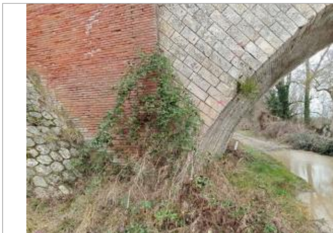
Marque sur structure

Coordonnées WGS84 : X: 1.12864860 / Y: 43.99595810