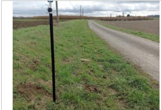
Débris végétaux

Coordonnées WGS84 : X: 1.16041390 / Y: 43.99860030