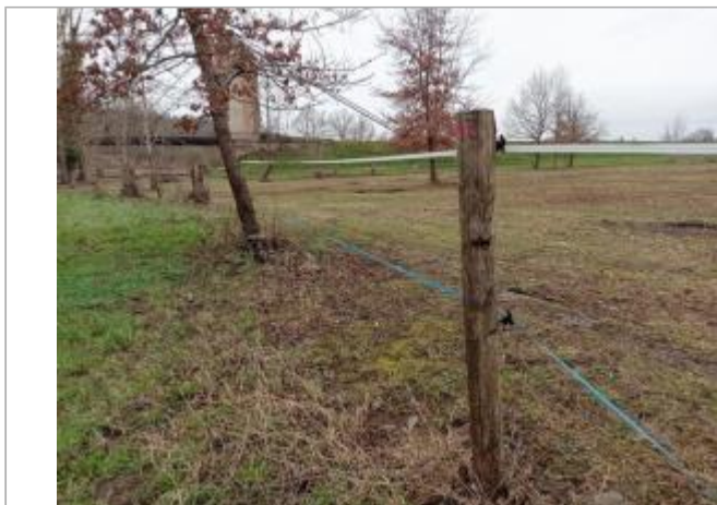
MARque sur poteau

Coordonnées WGS84 : X: 1.17369450 / Y: 43.94973320