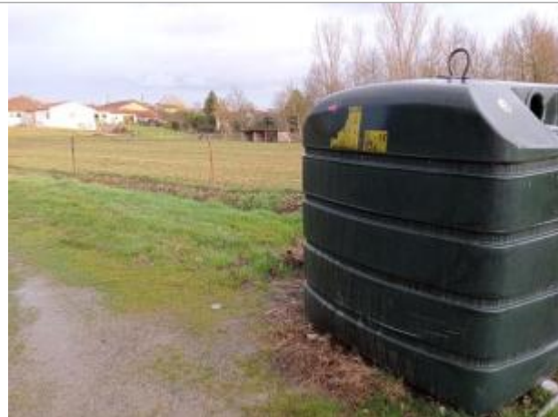
MARque sur PAV