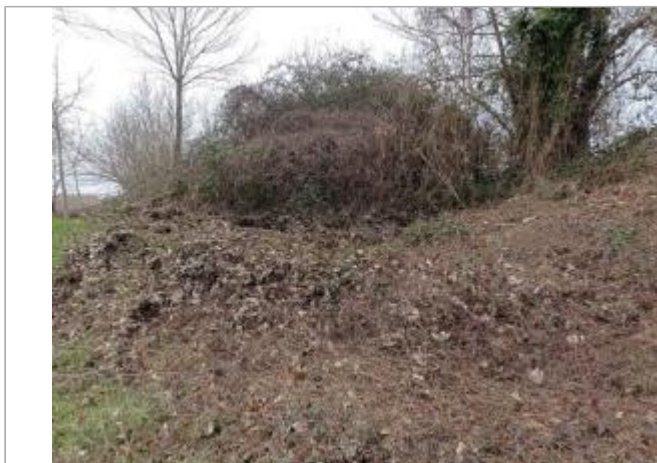
Débris végétaux

Coordonnées WGS84 : X: 1.21265360 / Y: 43.88787630