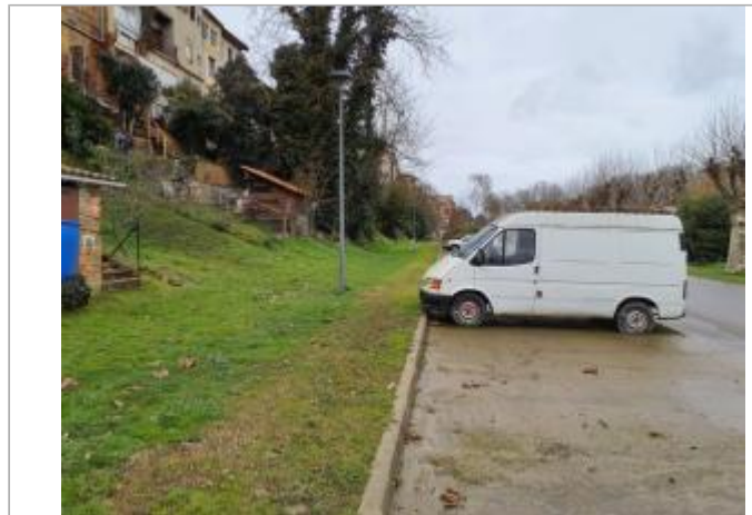
Marque sur véhicule

Coordonnées WGS84 : X: 1.23853910 / Y: 43.85113580