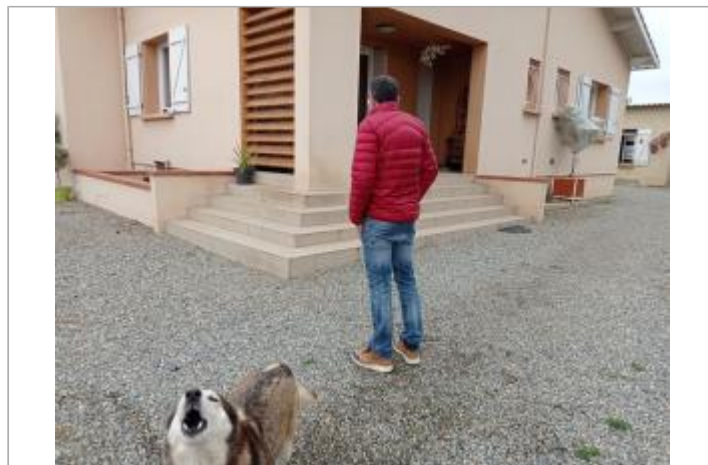
Marque sur structure (témoignage)

GÉOLOCALISATION Coordonnées WGS84 : X: 1.28517080 / Y: 43.81145730 Coordonnées RGF93 (Lambert 93) X: 562015.94 / Y: 6302880.93 Coordonnées RGF93 (ETRS89) : X: 1.2851708 / Y: 43.8114573 Code Hydro: O--0000 Rive de référence: Droite