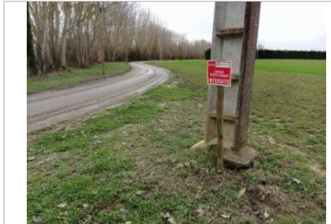
Marque sur poteau

Coordonnées WGS84 : X: 1.28759230 / Y: 43.80699890