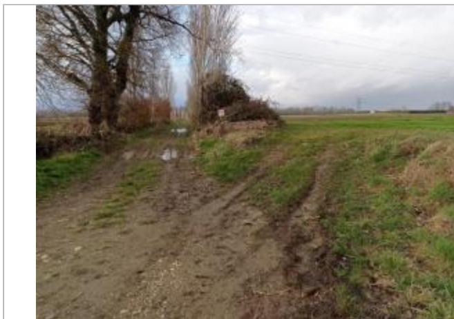
Débris végétaux

Coordonnées WGS84 : X: 1.28619330 / Y: 43.79832330