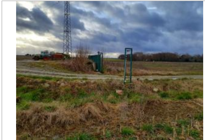
Marque sur rocher

Coordonnées WGS84 : X: 1.27671470 / Y: 43.78853150