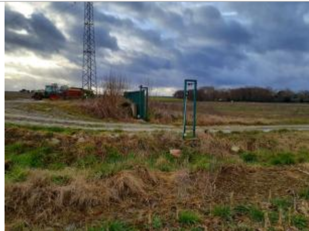
Marque sur rocher