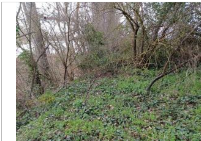
Débris végétaux