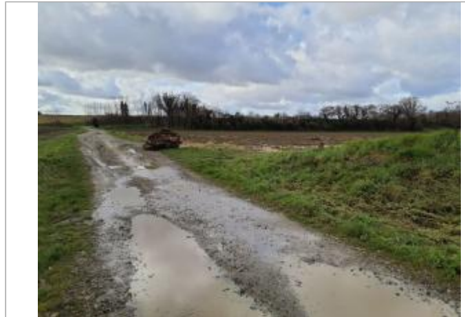
Débris végétaux

Coordonnées WGS84 : X: 1.31138500 / Y: 43.76390950