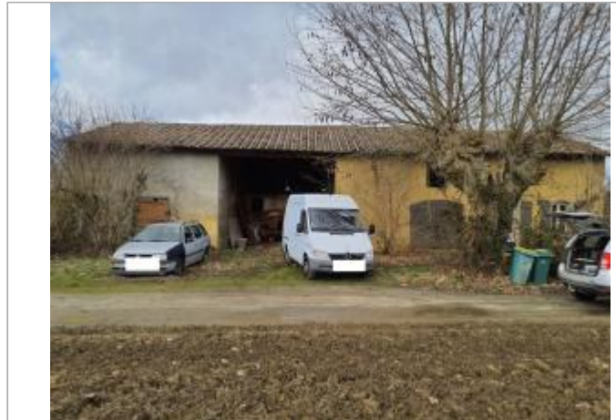
Marque sur véhicule

Coordonnées WGS84 : X: 1.31498640 / Y: 43.76191740