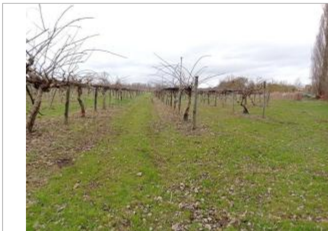
Marque sur végétaux

Coordonnées WGS84 : X: 1.32923950 / Y: 43.75828570