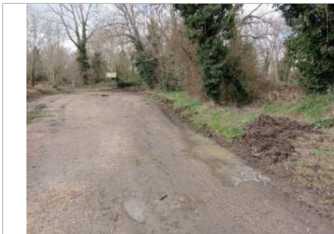
Marque sur Végétation

Coordonnées WGS84 : X: 1.31457900 / Y: 43.74923920