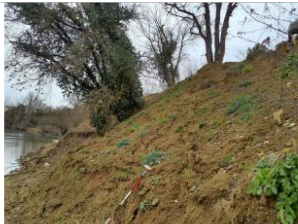
Marque sur talus