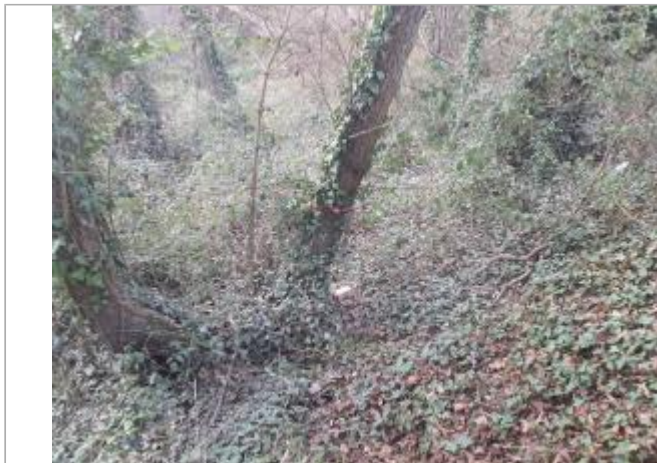
Larque sur Végétation