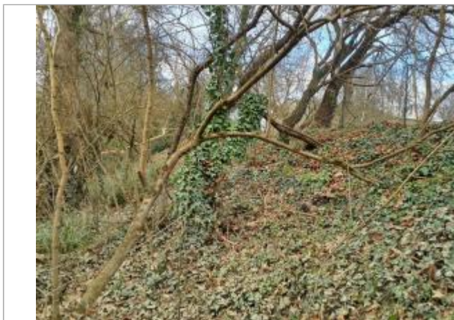
marque sur Végétation