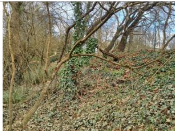
marque sur Végétation

Coordonnées WGS84 : X: 1.34592310 / Y: 43.72165220