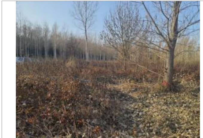
Marque sur Végétation

Coordonnées WGS84 : X: 1.33937720 / Y: 43.71901730