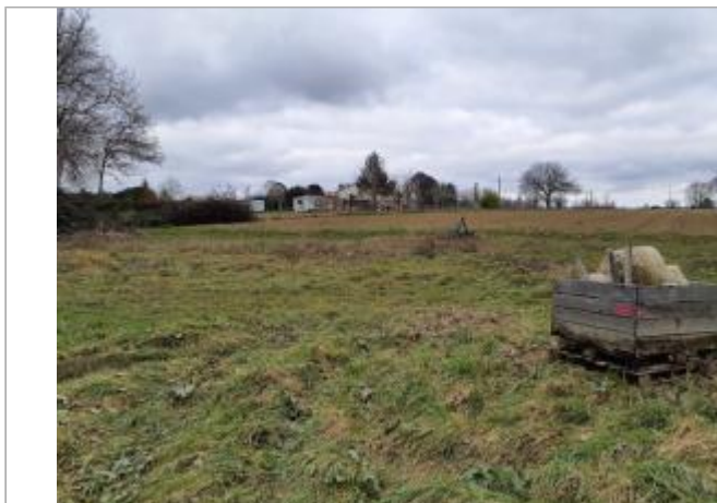
Marque sur box en bois