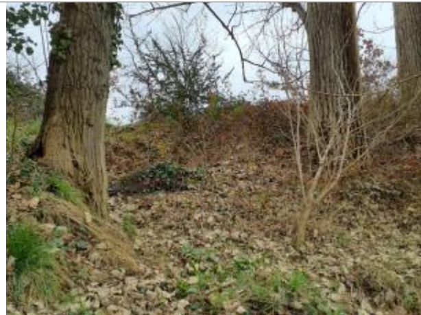
marque sur dépôt de béton