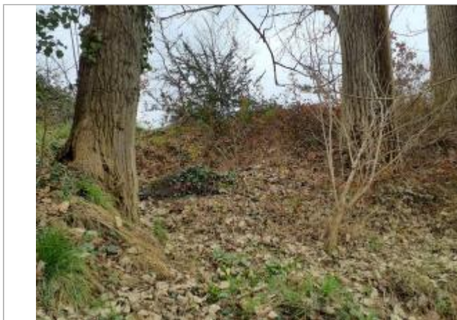
marque sur dépôt de béton