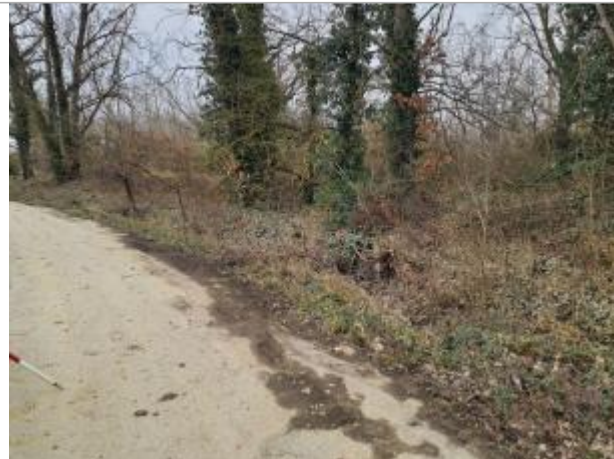
Marque sur Végétation

Coordonnées WGS84 : X: 1.35249820 / Y: 43.71239920