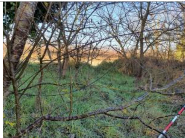
Marque sur Végétation

Coordonnées WGS84 : X: 1.36259540 / Y: 43.70297770