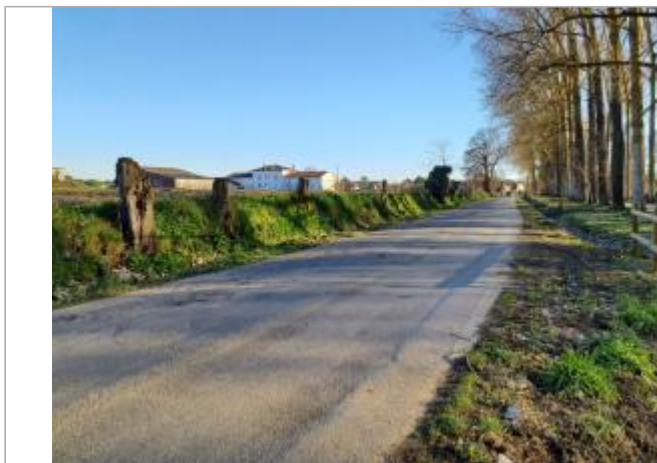
Débris végétaux

Coordonnées WGS84 : X: 1.36639940 / Y: 43.70623210