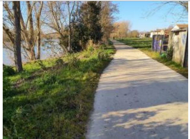
Débris végétaux

Coordonnées WGS84 : X: 1.36853100 / Y: 43.70164300