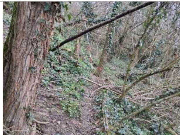
Marque sur végétaux