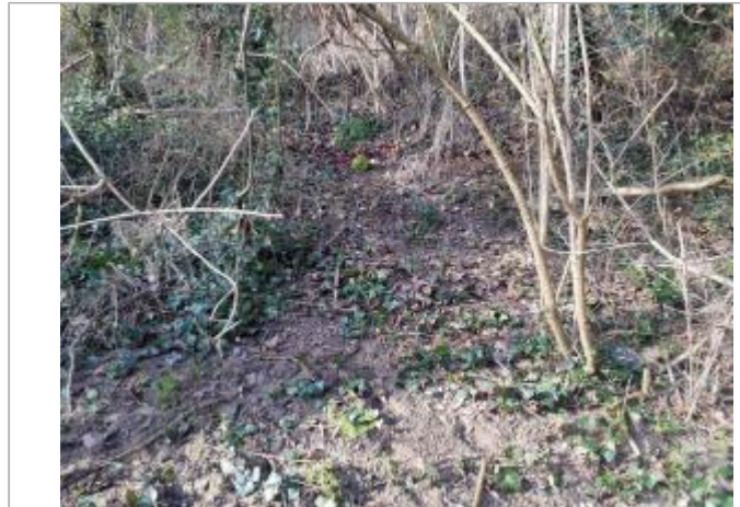
Marque sur végétaux

Coordonnées WGS84 : X: 1.37080650 / Y: 43.67888930