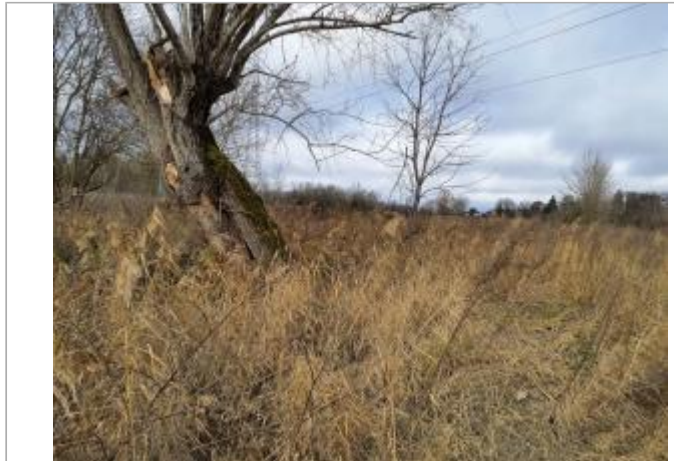
Marque sur végétaux

Coordonnées WGS84 : X: 1.40329980 / Y: 43.66653280