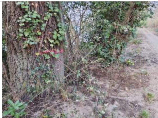
marque sur végétaux