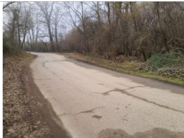
Marque sur Végétation