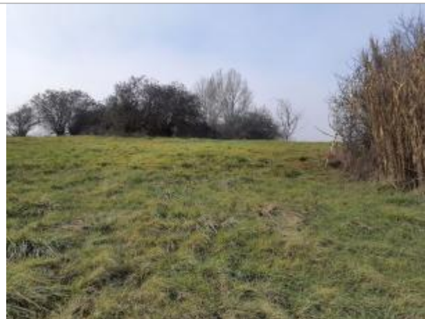
Trace sur Végétation

Coordonnées WGS84 : X: 1.40502670 / Y: 43.65800790