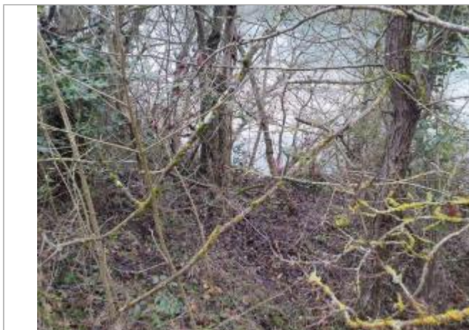
marque sur végétaux

Coordonnées WGS84 : X: 1.40734750 / Y: 43.65651110