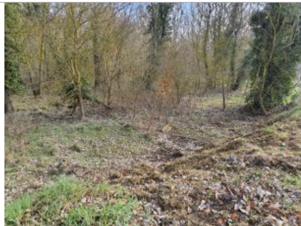
marque sur végétaux